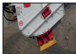
Magnet-Kit + Schalttafel