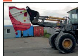
für Radlader / Teleskoplader